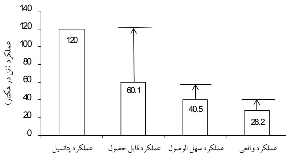
شکل ۲- مقایسه عملکرد واقعی، عملکرد سهل الوصول، عملکرد قابل حصول و عملکرد پتانسیل برای رقم مارفونا